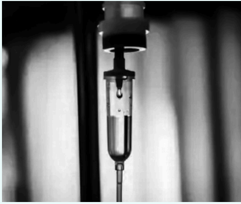
静脈からの全身投与（点滴）

老化予防（アンチエイジング）、冷え性改善、視力回復、睡眠障害改善、男性機能回復、血行改善などが期待できます。