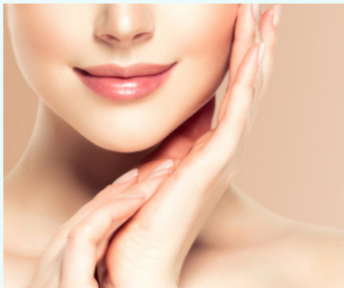
皮下への投与（メソガン）

損傷や痛みが気になる部位に注入します。注入した部位では細胞が活性化し組織の回復が行われ、炎症を抑えたり、痛みを軽減することが期待されます。